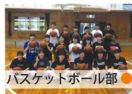
バスケットボール部 ●