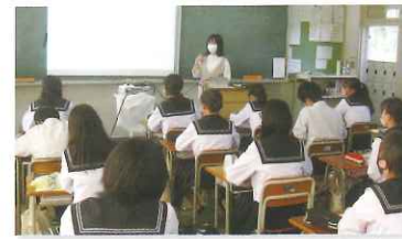
卒業生からのメッセージ(進路アドバイス)