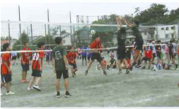
校技バレーボール大会