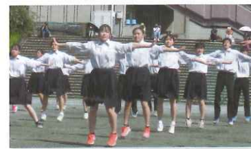
楠祭(体育祭)・応援合戦