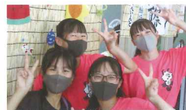
楠祭(文化祭)・クラス発表