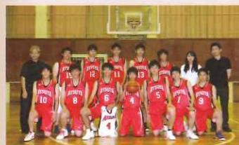
〈バスケットボール部〉